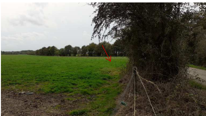
Vue 7 depuis le chemin communal