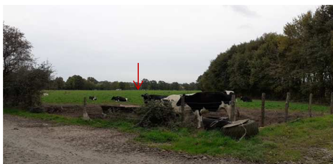
Vue 6 depuis la voie communale