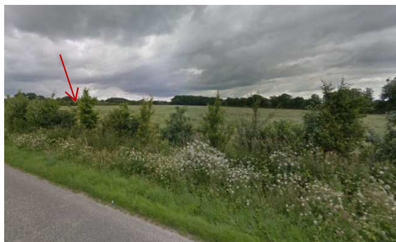
Vue 2 depuis la D24