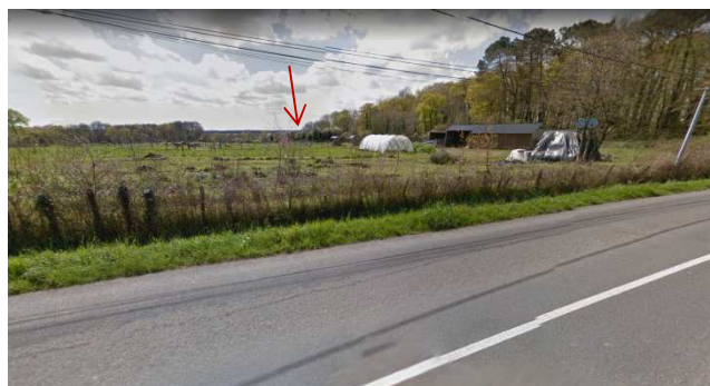
Vue 4 depuis la D2