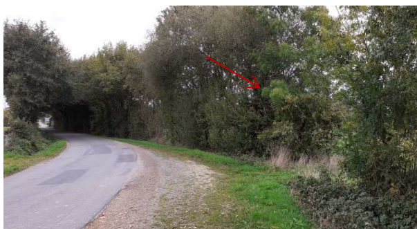
Vue 5 depuis la voie communale