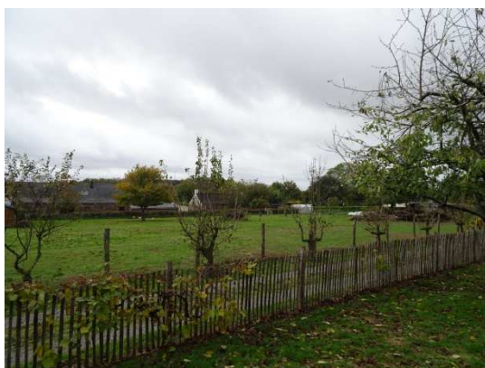
Mathieu Blut 7