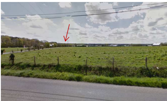
Vue 3 depuis la D2