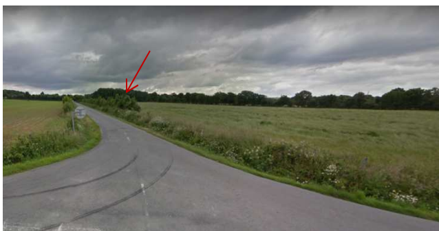
Vue 1 depuis la D24