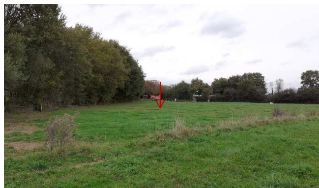
Vue 8 depuis la parcelle